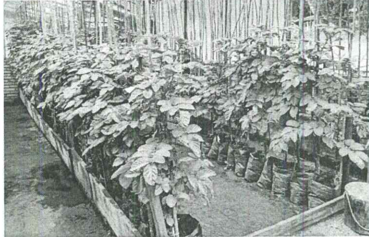
Imagen 1. Bloque de cruzamiento.