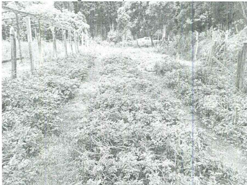
Imagen 2. Colección de Phureja grupo 2