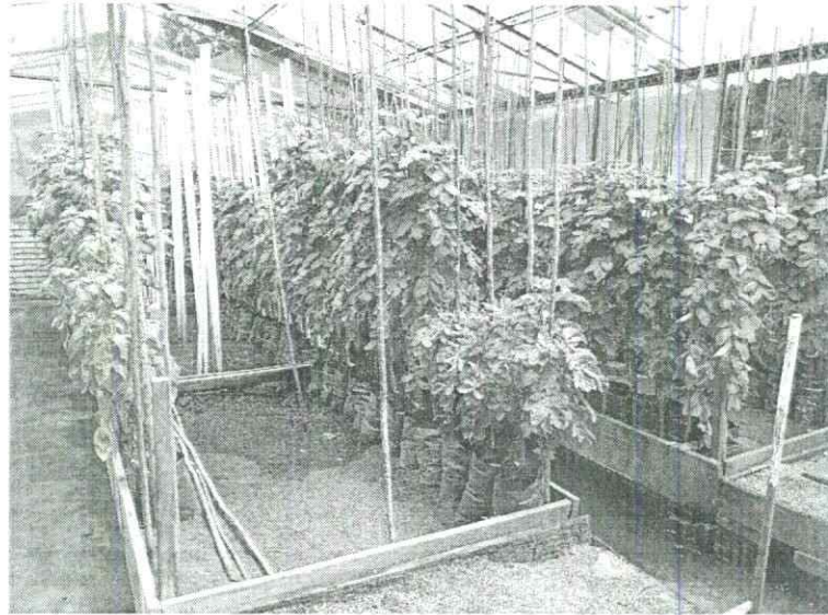
Imagen 1. Bloque de cruzamiento.