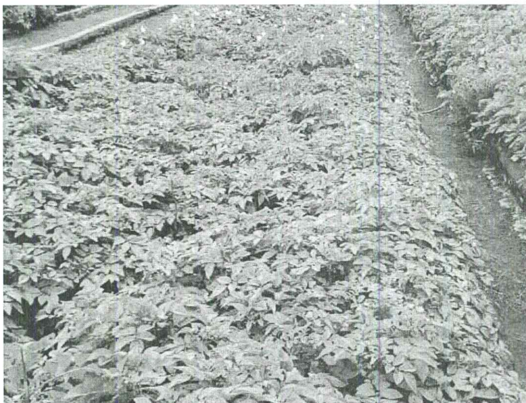
Imagen 3. Germoplasma de granja San Jorge.