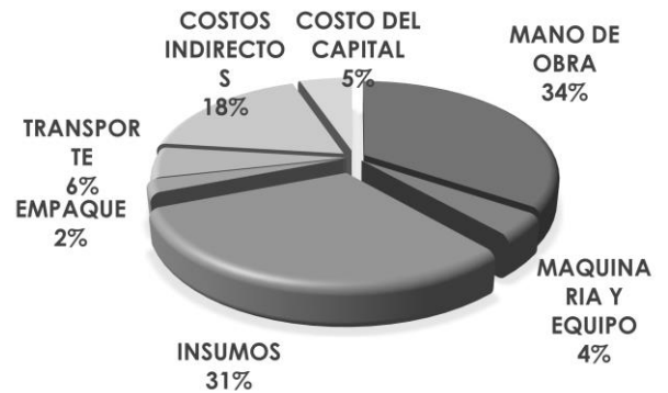
Gráfica 1. Desagregación de Costos de producción (Ha) de papa Criolla – Colombia 2018