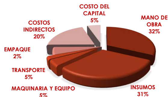
Gráfica 1. Desagregación de Costos de producción (Ha) Criolla - 2018 Cundinamarca