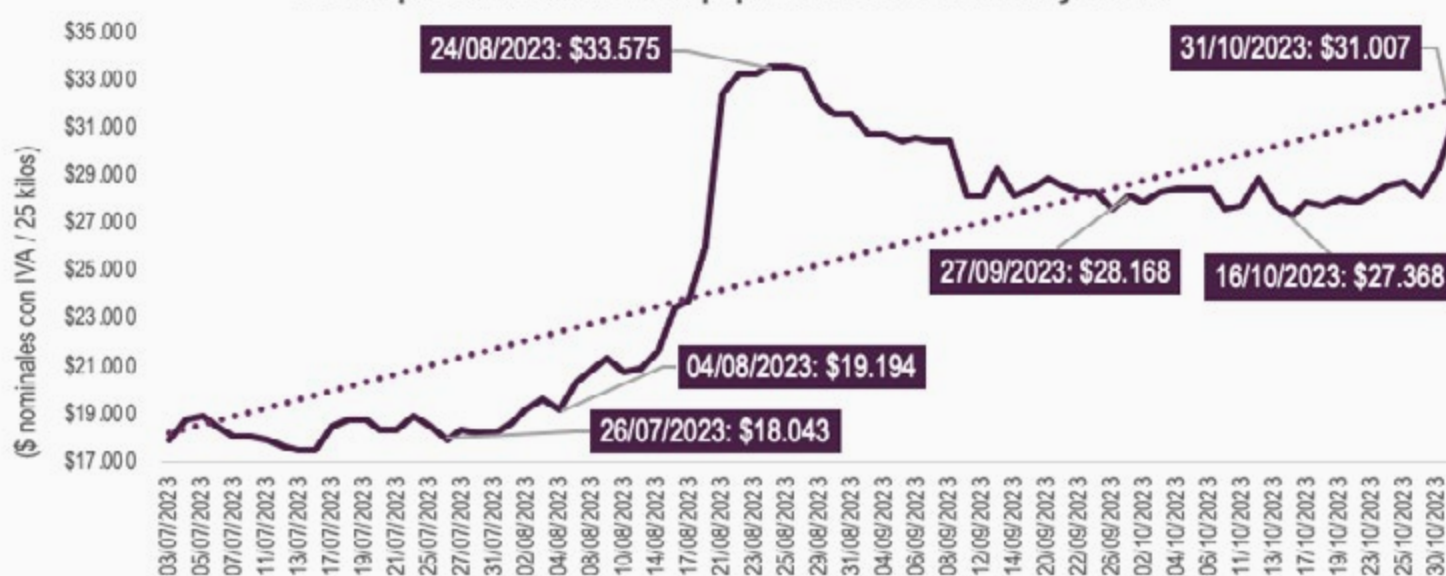
Precio promedio diario de la papa en los mercados mayoristas