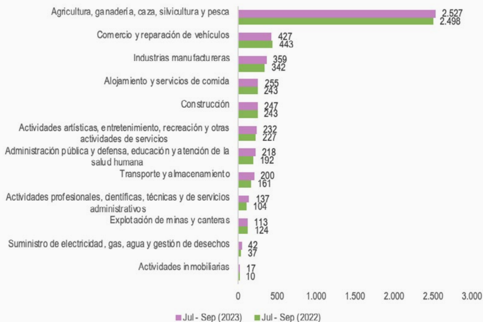
Población ocupada según ramas de actividad trimestre julio - septiembre 2022 - 2023

Fuente: GEIH - DANE. Cálculos Estudios Económicos Fedepapa -FNFP